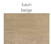
Musterauswahl. In vielen weiteren Dekoren erhältlich Range of patterns. Available in other decors