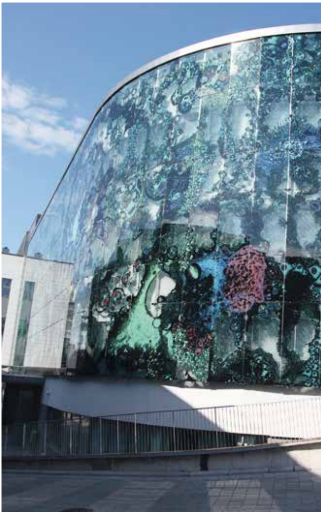
Kuopio University Hospital, printed by: Rakla, Finland