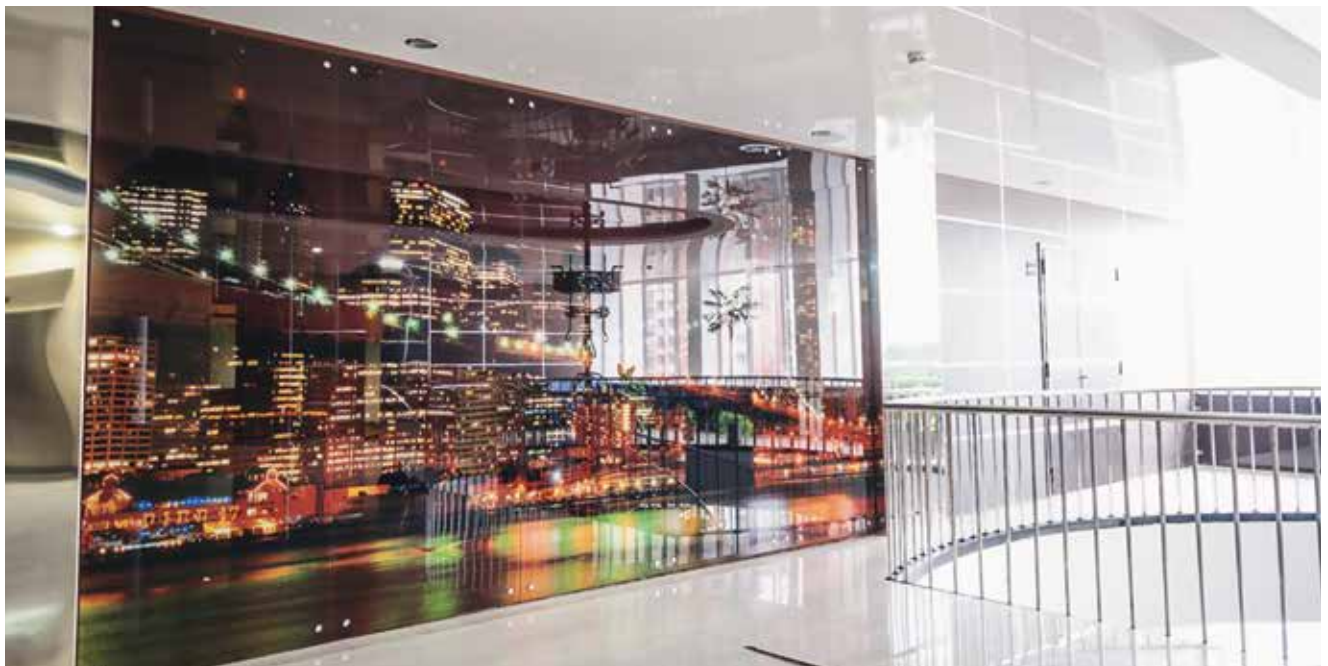
Meridian Business Center, printed by: Russian Glass Company (RSK), Russia

Auf Wunsch beraten wir Sie auch gerne zu Darstellungen und stellen über Bildagenturen kostenpflichtige Motive zur Verfügung. In Einzelfällen können wir gelieferte Daten auf Druckfähigkeit prüfen. Wir gehen aber im Regelfall von produzierbaren Daten aus.