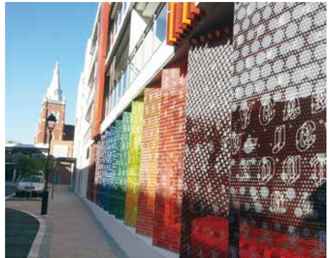
Spectrum' Public Art, printed by: Cooling Brothers, Australia