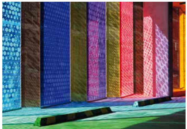
Spectrum' Public Art, printed by: Cooling Brothers, Australia

Ceramic digital printing is suitable for indoor and outdoor use and lends new inspiration for interior work for private, commercial and public customers as well as providing inspiration for designing building facades. The process can apply up to six different colours at the same time and affords a smooth surface with an appreciably subtle texture.